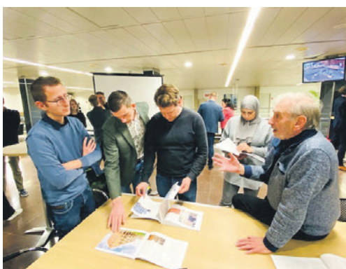
Inwoners en organisaties gaan op Het Plein over hun ideeën en plannen in gesprek met raadsleden.