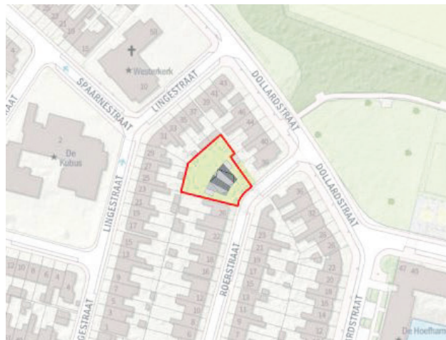
Toekomstige situatie Roerstraat 28-30.

Op 24 mei 2022 is een aanvraag voor een omgevingsvergunning ingediend voor het bouwen van twee woningen aan de Roerstraat 28 en 30. De initiatiefnemer is van plan om het bestaande bedrijfsgebouw te slopen. Daarvoor in de plaats komen twee nieuwe woningen. Het plan past niet in het bestemmingsplan. Het college vraagt de gemeenteraad om een ontwerpverklaring van geen bedenkingen af te geven. Daarna kan dit ter inzage worden gelegd en vervolgens definitief worden. Met een verklaring van geen bedenkingen geeft de raad aan geen bezwaar te hebben tegen het bouwplan.