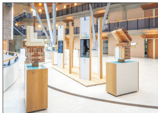
De expositie is van 9 tot 5 gratis te bezoeken op de vide in de hal.

beschermde stadsgezichten zijn er meer mogelijkheden. Via www.amersfoort.nl/duurzaam-erfgoed kunt u meer informatie vinden over wat er zonder vergunning wel kan. Kijk voor vragen of een advies op maat op deze website of neem contact op met de afdeling Monumentenzorg via monumentenzorg@amersfoort.nl of via telefoonnummer 14033.