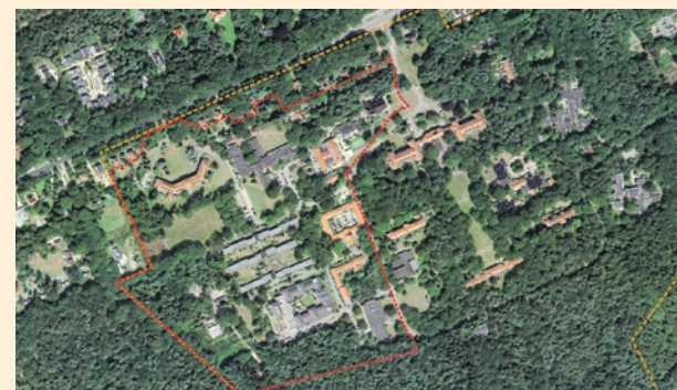
Luchtfoto terrein Zon & Schild.

Na vaststelling van het uitwerkingsvoorstel start de planontwikkeling van de delen midden en oost. Daar moeten zo'n vijfhonderd woningen komen, waaronder woningen voor mensen die lichtere ondersteuning en zorg aan huis (ambulante zorg) nodig hebben.