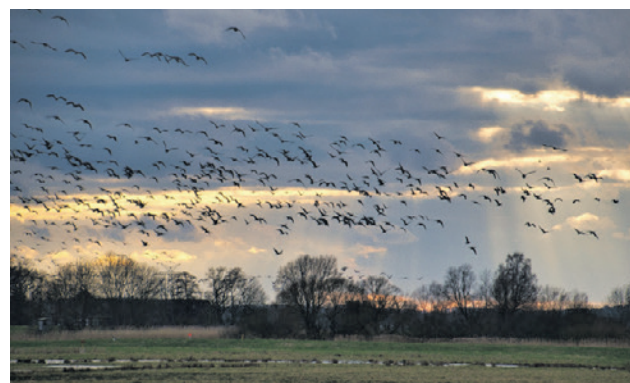
Met een detectienetwerk kunnen windmolens stilgezet worden als trekvogels in de buurt zijn.

Het raadsvoorstel werd aangenomen met 21 stemmen voor (CDA, ChristenUnie, D66, GroenLinks en Partij voor de Dieren) en 11 stemmen tegen (Amersfoort voor Vrijheid, Amersfoort2014, BPA, Beter Amersfoort, PvdA, SP en VVD).