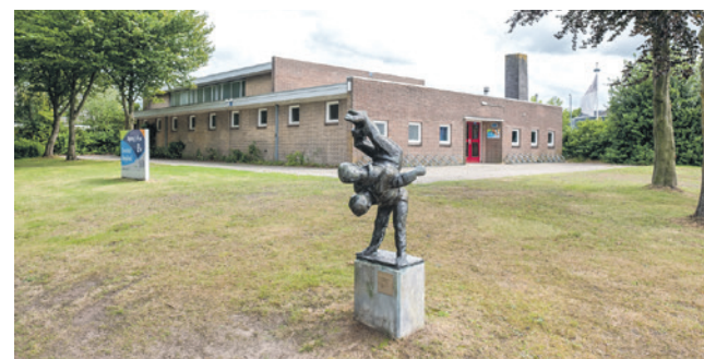
Het huidige zwembad in Hoogland is hoognodig aan vervanging toe.

Het raadsvoorstel werd met een gewijzigd raadsbesluit aangenomen met 32 stemmen voor (Amersfoort voor Vrijheid, Amersfoort2014, BPA, CDA, ChristenUnie, D66, GroenLinks, Partij voor de Dieren, PvdA, SP en VVD) en 1 stem tegen (Beter Amersfoort).