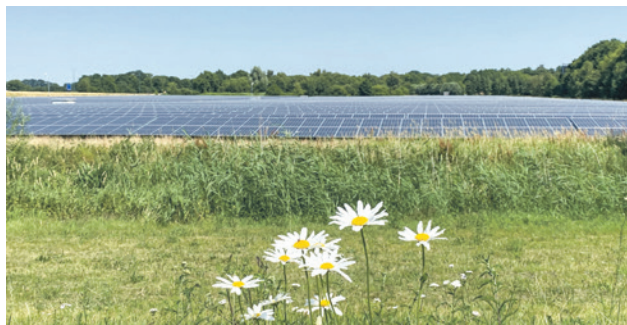
Het zonnenveld naast het Meander medisch centrum

- werken aan windenergie in: Wind op Isselt en de OER A28 (Vlasakkers; langs de A28 (ter hoogte van de Leusderheide) en de Poort van Amersfoort); - werken aan zonne-energie langs de snelweg A1 en OER A28; - Het bevoegd gezag voor de geplande windlocaties Vlasakkers en Langs de A28 bij de provincie te laten. Bij het raadsvoorstel werden vijf amendementen en een motie ingediend. De vijf amendementen werden verworpen, de motie aangenomen.