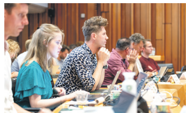
De raad in vergadering (foto: Annemoon van Hemel).

Een week later, tijdens raadsvergadering Het Besluit van 9 juli, neemt de gemeenteraad besluiten over de amendementen en moties die bij de kadernota worden ingediend. De raad