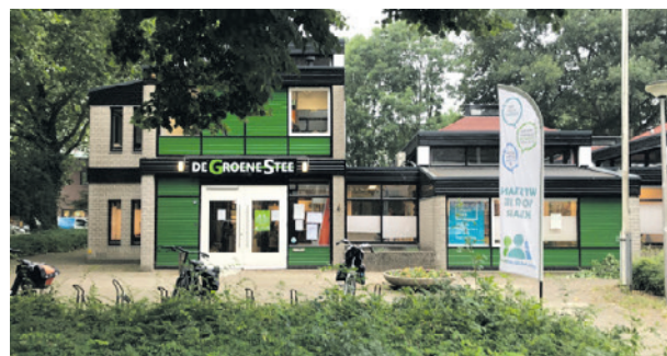
Het inloopspreekuur is in wijkcentrum De Groene Stee.

Het spreekuur is er om uw mening te kunnen geven over plannen van de gemeente. Ook kunt u zorgen uiten over wat er speelt in uw buurt, vragen stellen, een goed idee inbrengen, of gewoon kennismaken met raadsleden. U kunt zonder afspraak binnenlopen. Verschillende raadsleden zijn aanwezig om met u in gesprek te gaan. We zien u graag op 6 juli! De locatie is wijkcentrum De Groene Stee, Wiekslag 92, 3815 GS in Amersfoort.