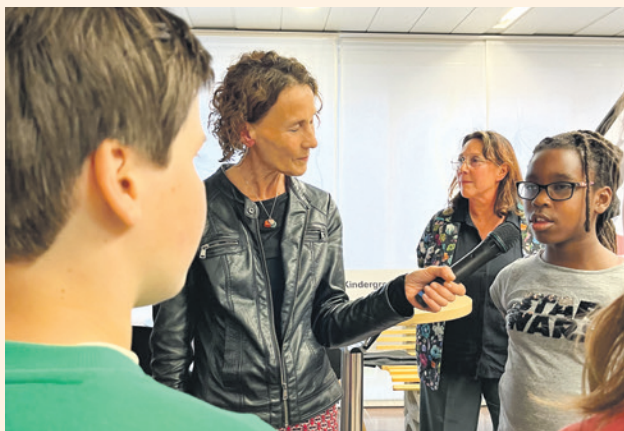
Een leerling van Scholen in de Kunst aan het woord (foto: griffie).

Leerlingen van Scholen in de Kunst boden aan fractievoorzitters de Kindergrondwet aan. Daarin staan grondrechten die de kinderen belangrijk vinden en zelf opgeschreven hebben, zoals respect hebben voor elkaar en elkaar gelijk behandelen. Volleybalvereniging Switch Hooglanderveen vroeg aandacht voor de mogelijkheden om meer mensen te laten sporten bij de vereniging. De club groeit en er staan veel kinderen op de wachtlijst. Er is meer sportfaciliteit nodig. De club vroeg de