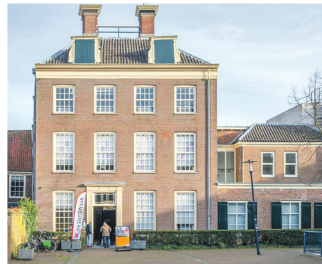
Met een aangenomen amendement zorgde de raad ervoor dat het fractiebudget binnen drie maanden voor verkiezingen niet mag worden gebruikt voor bijeenkomsten met een open karakter.

Het door de aangenomen amendementen gewijzigde raadsbesluit werd unaniem aangenomen.