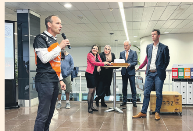
Een lid van volleybalvereniging Switch Hooglanderveen.

Wilt u ook uw idee, plannen of ambities voor de stad delen met de raadsleden? De volgende raadsinformatiemarkt - en de laatste voor de zomervakantie - is op 9 juli. U kunt zich aanmelden op telefoonnummer 033 469 4379 (raadsgriffie) of via e-mail: gemeenteraad@amersfoort.nl . Op amersfoort.nl/gemeenteraad vindt u meer informatie.