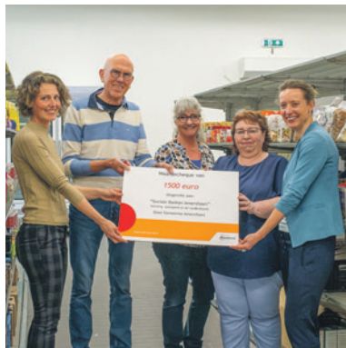
Medewerkers van de sociale banken (links) en stadsboerderij ontvangen een waardecheque.

Informatie over de gemeentebelastingen. www.amersfoort.nl/belastingen of bel 14 033.