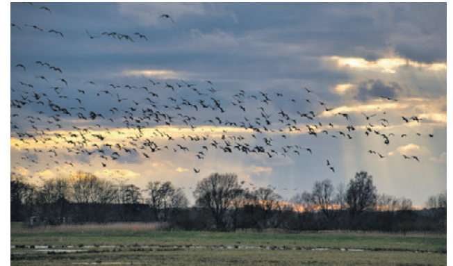
Met een detectienetwerk kunnen windmolens stilgezet worden als trekvogels in de buurt zijn.

Het raadsvoorstel werd aangenomen met 21 stemmen voor (CDA, ChristenUnie, D66, GroenLinks en Partij voor de Dieren) en 11 stemmen tegen (Amersfoort voor Vrijheid, Amersfoort2014, BPA, Beter Amersfoort, PvdA, SP en VVD).