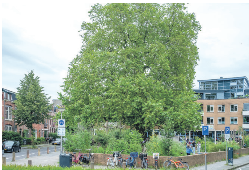
De bij inwoners geliefde plataan bij de St. Jorisschool

Wilt u op de hoogte blijven van de actualisatie? Kom dan in het najaar naar de avond 'Groenvisie in Vogelvlucht' in het Groene Huis. Kijk na de zomer voor de datum op www.hetgroenehuisamersfoort.nl