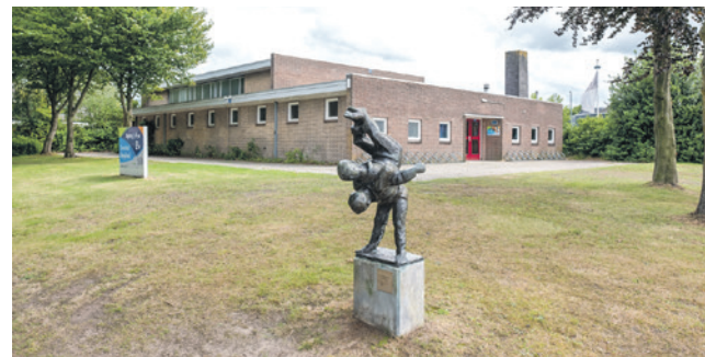
Het huidige zwembad in Hoogland is hoognodig aan vervanging toe.

Het raadsvoorstel werd met een gewijzigd raadsbesluit aangenomen met 32 stemmen voor (Amersfoort voor Vrijheid, Amersfoort2014, BPA, CDA, ChristenUnie, D66, GroenLinks, Partij voor de Dieren, PvdA, SP en VVD) en 1 stem tegen (Beter Amersfoort).