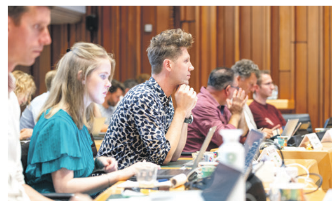
De raad in vergadering.

Een week later, tijdens raadsvergadering Het Besluit van 9 juli, neemt de gemeenteraad besluiten over de amendementen en moties die bij de kadernota worden ingediend. De raad