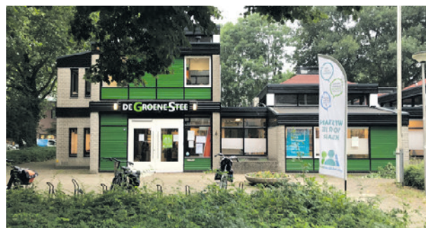
Het inloopspreekuur is in wijkcentrum De Groene Stee.

Het spreekuur is er om uw mening te kunnen geven over plannen van de gemeente. Ook kunt u zorgen uiten over wat er speelt in uw buurt, vragen stellen, een goed idee inbrengen, of gewoon kennismaken met raadsleden. U kunt zonder afspraak binnenlopen. Verschillende raadsleden zijn aanwezig om met u in gesprek te gaan. We zien u graag op 6 juli! De locatie is wijkcentrum De Groene Stee, Wiekslag 92, 3815 GS in Amersfoort.