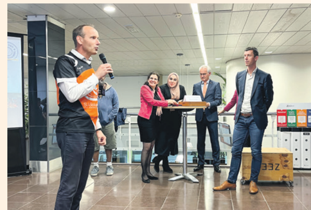
Een lid van volleybalvereniging Switch Hooglanderveen.

Wilt u ook uw idee, plannen of ambities voor de stad delen met de raadsleden? De volgende raadsinformatiemarkt - en de laatste voor de zomervakantie - is op 9 juli. U kunt zich aanmelden op telefoonnummer 033 469 4379 (raadsgriffie) of via e-mail: gemeenteraad@amersfoort.nl . Op amersfoort.nl/gemeenteraad vindt u meer informatie.