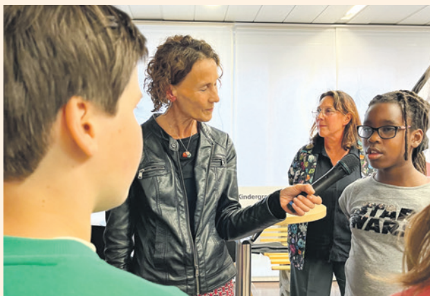
Een leerling van Scholen in de Kunst aan het woord.

Leerlingen van Scholen in de Kunst boden aan fractievoorzitters de Kindergrondwet aan. Daarin staan grondrechten die de kinderen belangrijk vinden en zelf opgeschreven hebben, zoals respect hebben voor elkaar en elkaar gelijk behandelen. Volleybalvereniging Switch Hooglanderveen vroeg aandacht voor de mogelijkheden om meer mensen te laten sporten bij de vereniging. De club groeit en er staan veel kinderen op de wachtlijst. Er is meer sportfaciliteit nodig. De club vroeg de