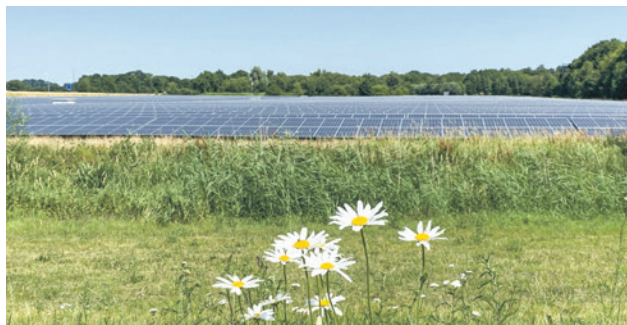
Het zonnenveld naast het Meander medisch centrum

- werken aan windenergie in: Wind op Isselt en de OER A28 (Vlasakkers; langs de A28 (ter hoogte van de Leusderheide) en de Poort van Amersfoort); - werken aan zonne-energie langs de snelweg A1 en OER A28; - Het bevoegd gezag voor de geplande windlocaties Vlasakkers en Langs de A28 bij de provincie te laten. Bij het raadsvoorstel werden vijf amendementen en een motie ingediend. De vijf amendementen werden verworpen, de motie aangenomen.