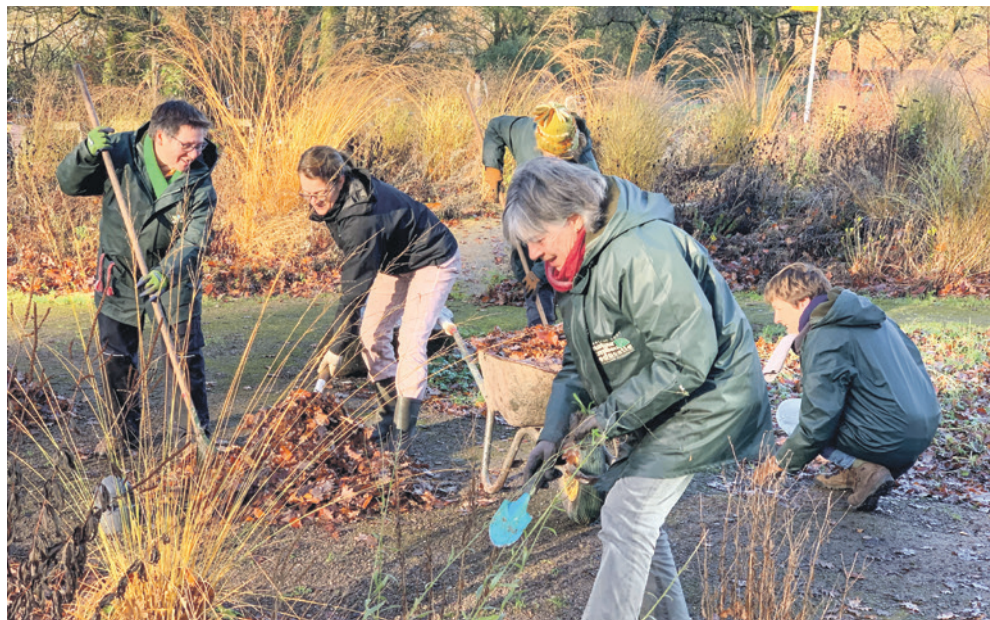
Vrijwilligers in het groen

Bekijk de vacature op: www.hetgroenehuisamersfoort.nl .