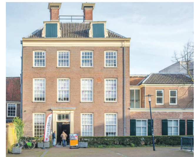
Met een aangenomen amendement zorgde de raad ervoor dat het fractiebudget binnen drie maanden voor verkiezingen niet mag worden gebruikt voor bijeenkomsten met een open karakter.

Het door de aangenomen amendementen gewijzigde raadsbesluit werd unaniem aangenomen.