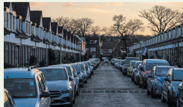
Parkeervergunningen worden volgend jaar duurder.

Het college is van plan het nieuwe parkeerbeleid in december ter inzage te leggen. Dat betekent dat belanghebbenden zes weken de tijd hebben om een