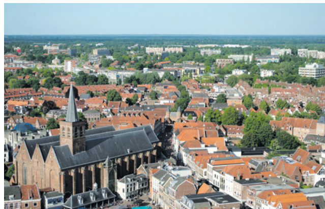
In de Meerjarenbegroting 2025-2028 staan de plannen voor de komende jaren.

De begroting maakt duidelijk dat het college wil blijven investeren in meer woningen voor verschillende doelgroepen. Ook gaat er geld naar duurzaam vervoer, energie en een