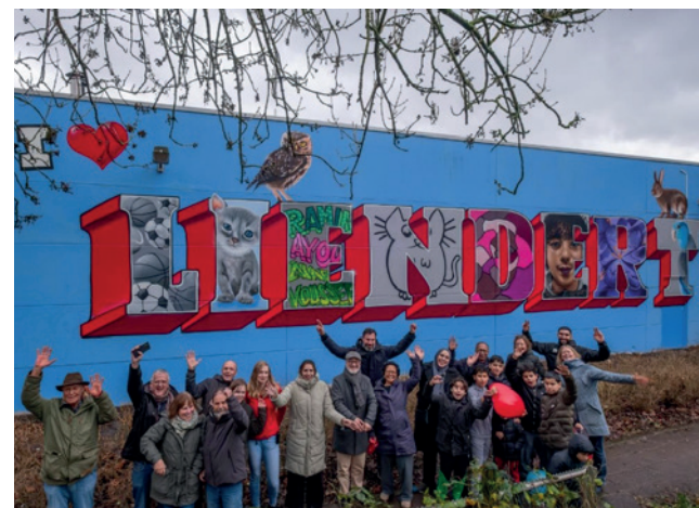
Inwoners van Liendert moeten dezelfde kansen krijgen als andere inwoners van Amersfoort (bron: omgevingsprogramma Wij-Liendert).

Meer informatie over de plannen staat op amersfoort.nl/aan-de-slag-met-liendert .