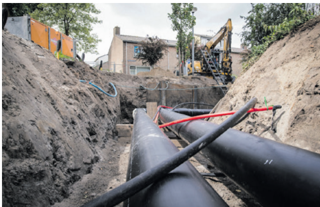
Een warmtenet verwarmt huizen en gebouwen op een duurzame manier.

Een warmtenet is een netwerk van ondergrondse leidingen waardoorheen warm water stroomt. Het systeem verwarmt huizen en gebouwen. Nu zijn meerdere commerciële warmtebedrijven in Amersfoort verantwoordelijk voor een eigen warmtenet. In verschillende buurten in Amersfoort zijn warmtenetten in gebruik of in voorbereiding.