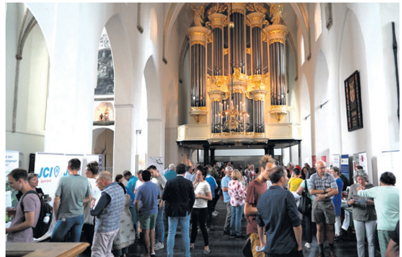
De informatiemarkt in de Sint-Joriskerk.

Wilt u ook een plek op de informatiemarkt van Amersfoort Aangenaam? Meld u zich dan voor