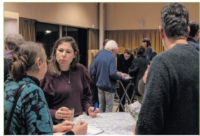
Bij de herontwikkeling van een gebied moet de initiatiefnemer belanghebbenden betrekken.

Het college werkt aan nieuw parkeerbeleid dat de groeiende stad leefbaar moet houden. De invoering van vergunningparkeren is daar onderdeel van. Het college wil het nieuwe parkeerbeleid eind december ter inzage leggen. Dat betekent dat belanghebbenden zes weken de tijd hebben om een zienswijze (officiële reactie) in te dienen. De gemeenteraad behandelt de plannen in het voorjaar.