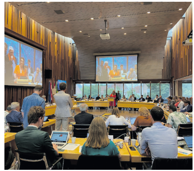
De raad onderzoekt hoe het zijn eigen vergadermodel kan verbeteren.

De huidige manier van vergaderen is ingevoerd in januari 2023. Toen is onder andere gestart met het vergaderen in vier raadscommissies. Dit zijn de commissies Omgeving, Bestuur, Bedrijvigheid en Sociaal. In de raadscommissies bereiden de leden raadsbesluiten voor. Zowel raadsleden als buitengewoon fractieleden kunnen lid worden van een commissie. Er kunnen meerdere fractieleden lid zijn van een commissie. Wel kan er maar één fractielid namens de fractie deelnemen aan een commissievergadering.