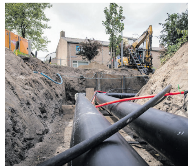
Een warmtenet kan huizen verwarmen zonder aardgas.

Met de warmtetransitie wordt bedoeld dat gebouwen en woningen van het aardgas afdagen of verduurzaamd worden. Veel mensen gebruiken aardgas voor verwarmen en koken. Er moeten duurzame alternatieven komen om aardgas te vervangen. Bij het gebruik van aardgas komt CO2 vrij. In het landelijke Klimaatakkoord staat dat in het jaar 2023 de uitstoot van CO2 55 procent minder moet zijn. Dit doel staat ook in het Amersfoortse coalitieakkoord.