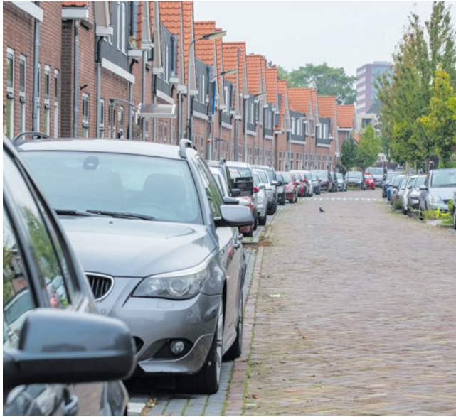
De gemeente voert vergunningparkeren in Amersfoort in fases in.

Op 22 oktober ging het vooral over het overdragen van de bevoegdheid van de raad aan het college om in grote delen van de stad te bepalen waar vergunningparkeren komt. Het college wilde in de verordening vastleggen dat Amersfoort vóór 2035 in de meeste wijken betaald parkeren met