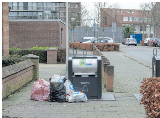
Als het aan het college ligt, bespreekt de eerste gelote Burgerraad het onderwerp afval verminderen.

In 2025 start de eerste gelote Burgerraad van Amersfoort. De leden van de Burgerraad worden geloot onder alle inwoners uit Amersfoort die ouder zijn dan zestien jaar. Dat is anders dan bij de gemeenteraad, want gemeenteraadsleden worden gekozen. De gelote Burgerraad bestaat uit 54 inwoners, die