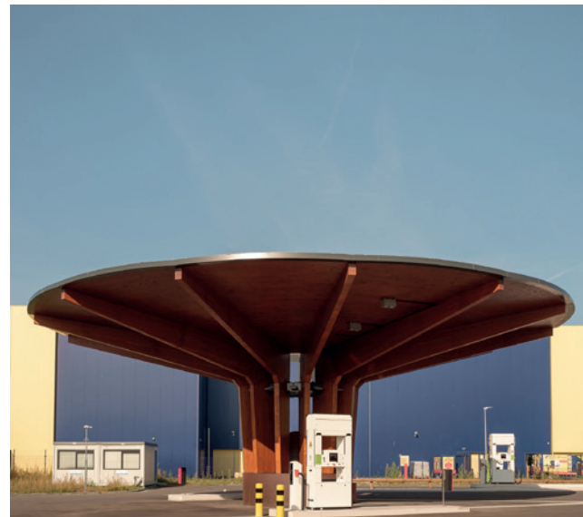
De fractie van D66 wil weten wat er in Amersfoort al gebeurt rondom het thema circulaire stad.

Begin 2025, zodra het college concrete inzichten heeft, komt het onderwerp opnieuw op de agenda. Het college deelt dan zijn bevindingen en zal commissieleden vragen verder mee te denken.