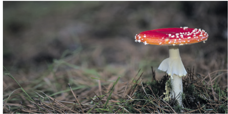
Vliegzwam, de paddenstoel uit het bekende kinderversje.

De lezing is dinsdag 26 november van 20.00 tot 22.00 uur in Het Groene Huis aan de Schothorsterlaan 21 in Amersfoort. De toegang is gratis, aanmelden is niet nodig.