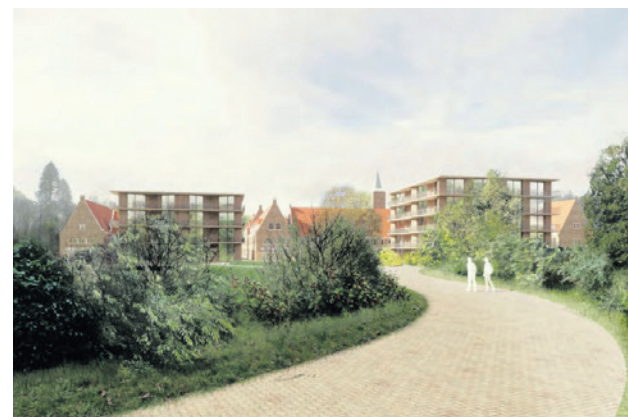
Een schets van hoe de nieuwbouw eruit kan komen te zien.

Het raadsvoorstel werd unaniem aangenomen.