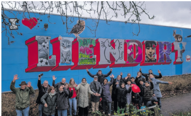
Inwoners van Liendert moeten dezelfde kansen krijgen als andere inwoners van Amersfoort (bron: omgevingsprogramma Wij-Liendert).

Het raadsvoorstel werd unaniem aangenomen.