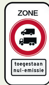
Het winkelgebied in de binnenstad moet vanaf januari 2025 grotendeels zonder uitstoot bevoorrad worden.

De motie ‘Uitstel zero-emissiezone’ werd verworpen met 31 stemmen tegen (D66, GroenLinks, CDA, ChristenUnie, VVD, Amersfoort2014, PvdA, Partij voor de Dieren, SP en Beter Amersfoort) en 3 stemmen voor (BPA, Amersfoort voor Vrijheid en DENK).