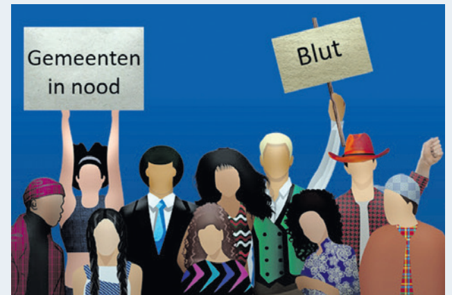
De gemeenteraad van Amersfoort sluit zich aan bij het actiecomité Raden in Verzet.

De motie 'Kom in verzet; geen bezuinigingen op het gemeentefonds' werd aangenomen met 33 stemmen voor en 1 stem tegen (Amersfoort voor Vrijheid).