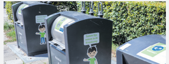
De tarieven die inwoners betalen voor afval hangen niet af van de hoeveelheid (rest)afval.

Het amendement 'Voorlopige financiële cijfers diftar' werd aangenomen met 32 stemmen voor en 2 stemmen tegen (SP).