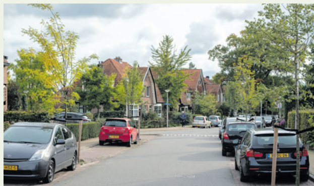
Amersfoort2014 en Beter Amersfoort stelden voor om het budget voor de mobiliteitstransitie te verlagen.

Het college ontraadde dit amendement omdat het budget nodig is om het omgevingsprogramma Mobiliteit uit te voeren. Dit staat los van de kosten voor het parkeerbeleid.