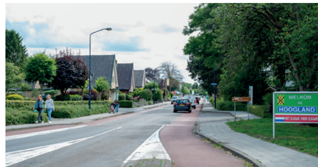
Het college onderzoekt locaties voor het nieuwe zwembad.

Het onderzoek brengt zaken als het effect op de omgeving en financiën verder in kaart. Ook kijkt het naar ecologie, verkeersdruk en parkeerdruk. Op basis van die bevindingen worden de locaties met elkaar vergeleken.