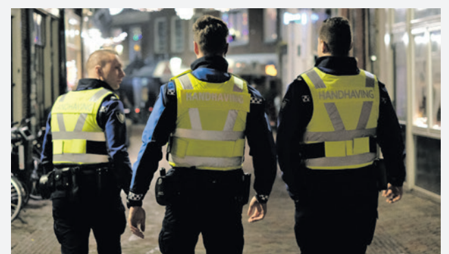
Het boa-team wordt aangevuld met vijf extra boa’s.

Het amendement ‘Boa-capaciteit verhogen’ werd aangenomen met 33 stemmen voor en 1 stem tegen (Amersfoort voor Vrijheid).