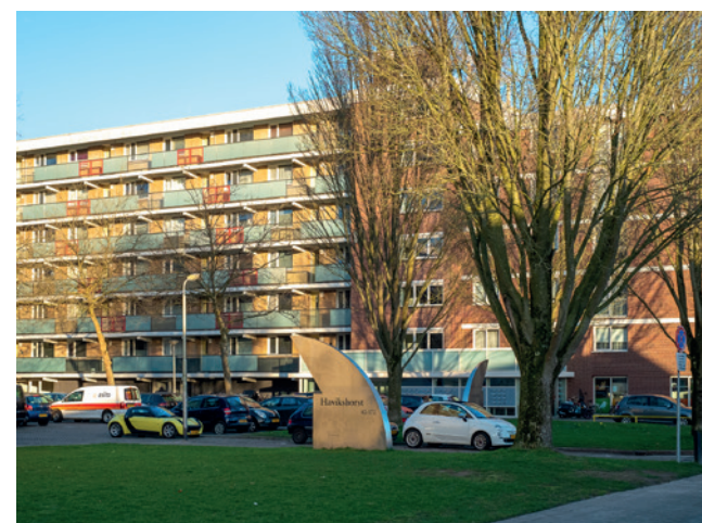
Amersfoort krijgt nieuwe regels voor sociale huur. De wethouder informeert de commissie hierover (foto: Simon Lamme).

De raad wordt meegenomen in bovenstaande onderwerpen en bespreekt een aantal "moeilijke keuzes" die hieruit naar voren komen. Dat gaat om het percentage sociale woningbouw, de verkoop van sociale huurwoningen, wijkgericht maatwerk en woningtoewijzing aan doelgroepen.