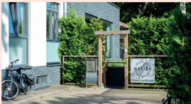
Het college wil meer bestaanszekerheid creëren in de stad door krachten van initiatieven te bundelen.

Commissieleden geven hun mening over het Uitvoeringsprogramma Meedoen en Rondkomen. Dit programma gaat over bestaanszekerheid in de stad.