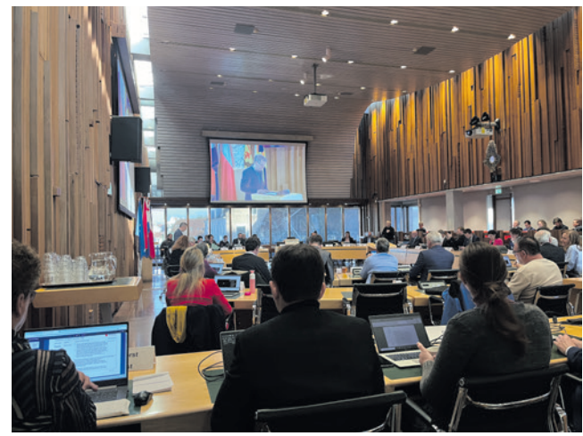
De raad debatteerde op 5 november over de nieuwe begroting van de gemeente.

Het geamendeerde (aangepaste) raadsvoorstel werd aangenomen met 25 stemmen voor (D66, GroenLinks, CDA, ChristenUnie, VVD, PvdA, Partij voor de Dieren en DENK) en 9 stemmen tegen (Amersfoort2014, SP, Beter Amersfoort, Amersfoort voor Vrijheid en BPA).