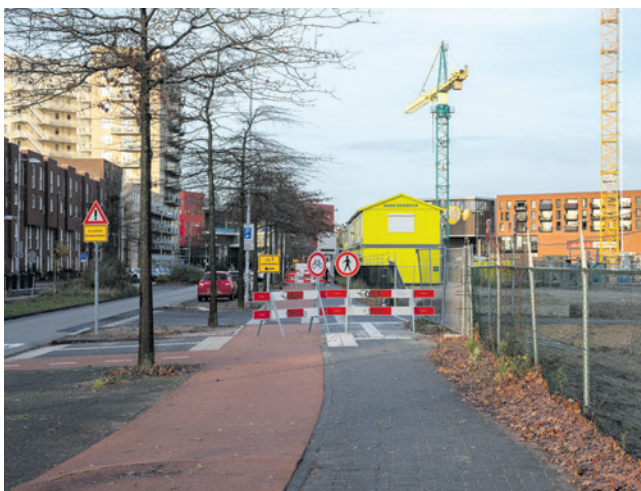
Fietsers en voetgangers komen in de knel bij wegomleidingen (foto: Simon Lamme).

Moeten fietsers en voetgangers ook bij wegomleidingen veel ruimte krijgen? Op verzoek van de fracties van D66 en GroenLinks gaat de commissie hierover in gesprek.