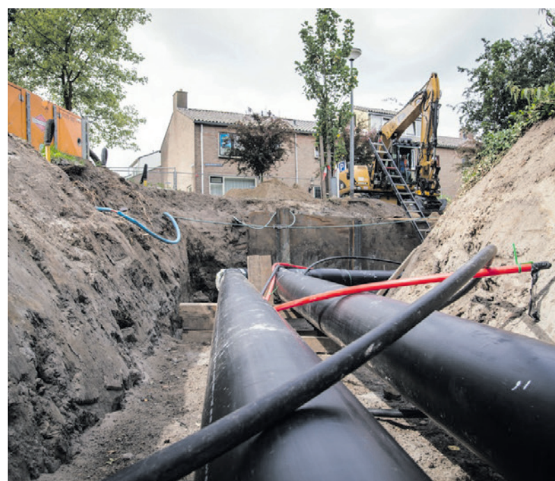
Een warmtenet is een duurzamere manier om huizen en gebouwen te verwarmen.

Een warmtenet is een netwerk van ondergrondse leidingen waar warm water doorheen stroomt. Het is duurzamer om huizen en gebouwen mee te verwarmen dan aardgas. Bij het gebruik van aardgas komt namelijk veel koolstofdioxide (CO 2 ) - een broeikasgas - vrij waardoor de aarde opwarmt. In het landelijke Klimaatakkoord staat dat in 2035 de uitstoot van CO 2 55 procent minder moet zijn. Dit doel staat ook in het Amersfoortse coalitieakkoord.