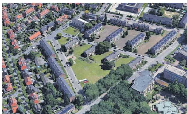
Woningcorporatie de Alliantie wil de driehoek Bosweg, Réaumurstraat en Kelvinstraat ontwikkelen met nieuwe woningen en een park.

De nieuwe woningen komen in een appartementencomplex van ongeveer achttien meter hoog. Het gaat om sociale huur en middenhuur. Ook komt er een parkachtige omgeving als plek voor ontmoeten, sporten en spelen. Er komen parkeerplaatsen onder het gebouw en op het maaiveld (grondhoogte). Volgens het bestemmingsplan