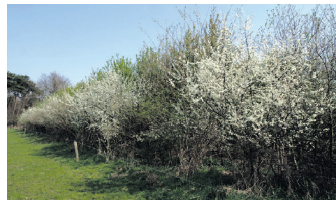
Bloeiende heggen trekken veel insecten aan en zijn leuk om te zien.

Heeft u vragen, heeft u ideeën of wilt u zich aansluiten, dan kunt u reageren via groenewijkraad.LR@gmail.com