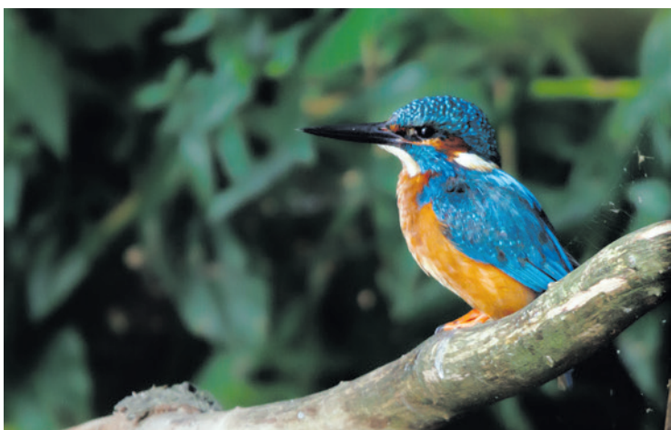
De ijsvogel is één van de 33 gidssoorten.

De avond begint om 19.00 uur in Het Groene Huis aan de Schothorsterlaan 21 in Amersfoort. Vanaf 18.00 uur is er de mogelijkheid om een hapje mee te eten. Aanmelden kan via groenestad@amersfoort.nl . Kijk voor meer informatie op: https://hetgroenehuisamersfoort.nl/agenda/groenvisie-in-vogelvlucht-15