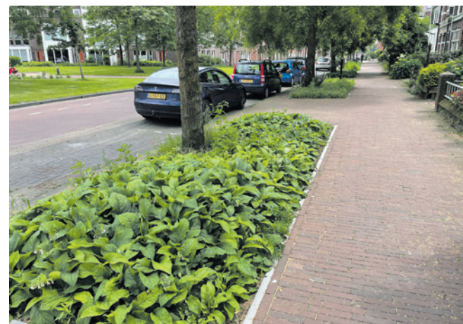
300 m 2 extra groen op de Puntenburg.

Deze ronde van het NK Tegelwippen is afgelopen. En al is er veel gebeurd: er is nog veel verharding in de stad die we best kunnen missen. Daarom gaat de gemeente door met het vergroenen van de openbare ruimte en de tegeltaxi gaat volgend jaar weer rijden. Via amersfoorttrainproof.nl vinden inwoners inspiratie en informatie over het vergroenen van hun tuin. Het motto is simpel: Amersfoort groen, moeten we samendoen!