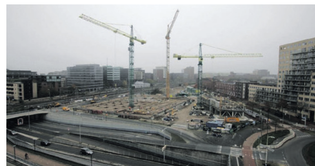
Het nieuwe stadhuis komt op de Trapeziumlocatie.

Meer informatie over het nieuwe stadhuis staat op amersfoort.nl/huis-voor-de-stad .