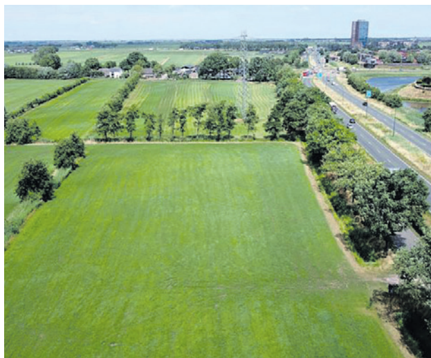
De islamitische begraafplaats komt in agrarisch gebied aan de rand van Hoogland-West.

Amersfoortse moslims hebben behoefte aan een eigen islamitische begraafplaats in Amersfoort. Op deze plek kunnen dierbaren volgens de eigen tradities, gebruiken en wensen begraven worden. Op verzoek van het Samenwerkingsverband van Amersfoortse Moskeeën (SvAM) zocht het college naar mogelijke locaties. Het college vond de locatie aan de Bunschoterstraat het meest geschikt. In december vorige jaar stemde de raad in met deze locatie.