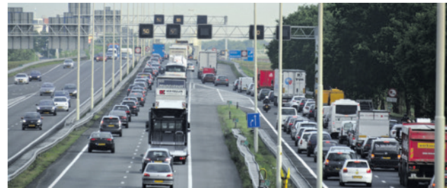
Het Rijk stelt de aanpak van knooppunt Hoevelaken weer uit.

Bij de ontwikkeling van het gebied zal de openbare ruimte worden aangepast. Dit is nodig voor de bouw van de nieuwe woningen en omdat de wegen onderhoud nodig hebben. Na de bespreking van het bestemmingsplan, bespreekt de commissie het voorstel van het college om hier geld voor beschikbaar te stellen.