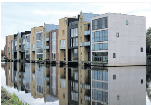
De onroerendezaakbelasting (ozb) stijgt volgend jaar met gemiddeld 4,5 procent.