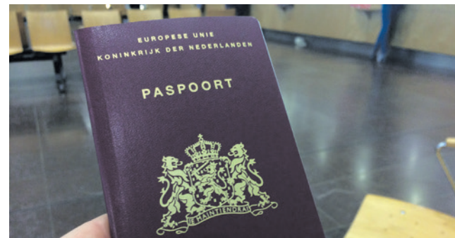
Een nieuw paspoort aanvragen kost volgend jaar enkele euro's meer.

Diensten van de gemeente zijn bijvoorbeeld de verstrekking van een paspoort, het voltrekken van een huwelijk, een bouwvergunning en een uittreksel uit het bevolkingsregister. In de legesverordening staan de tarieven (prijzen) van de diensten. Het college past dit elk jaar aan door veranderingen in wet- en regelgeving of nieuwe inzichten. De raad moet de verordening vaststellen die het college voor 2025 heeft opgesteld. Tijdens deze vergadering gaat de commissie in gesprek over de nieuwe legesverordening.