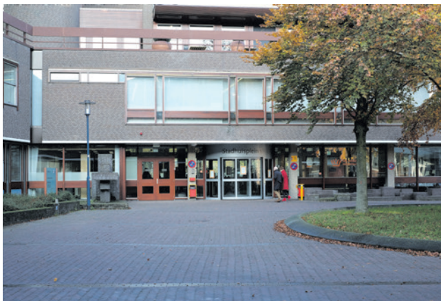
Door een hack van het digitale afsprakensysteem van een softwareleverancier van de gemeente zijn persoonsgegevens van inwoners gelekt (foto: Simon Lamme).

Van Lammeren beaamde dat er op dat moment nog steeds informatie over de software niet naar buiten was gebracht, in opvolging van juridisch advies.