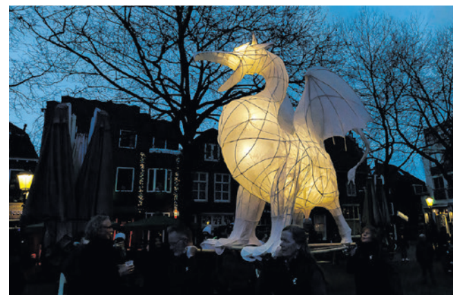
Drakenstier in het donker.

Geen tijd op oudejaarsavond? Geen probleem! Op 1 januari wordt de voorstelling herhaald op het Lieve Vrouwekerkhof. Om 16.00 uur geven de capoeiraspelers een workshop voor jong en oud. Onder begeleiding van de ervaren leraren van Batuque Capoeira maak je kennis met deze Braziliaanse kunstvorm, die vechtkunst, acrobatiek en muziek combineert.