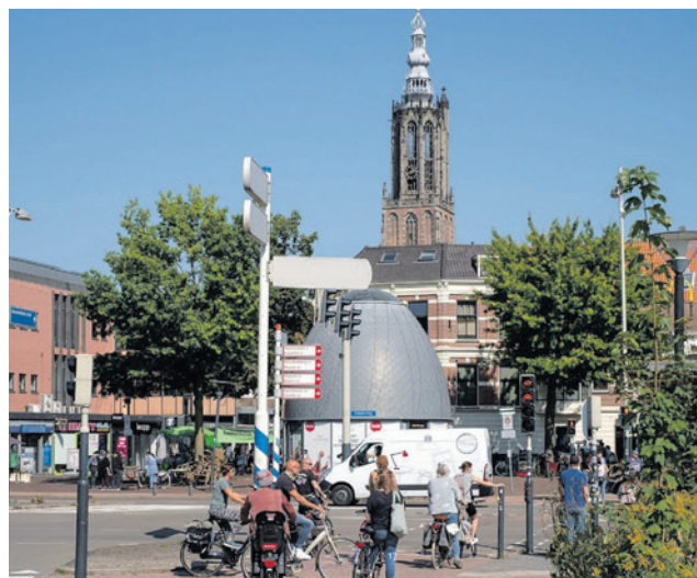
In het ontwerp-omgevingsprogramma Mobiliteit staat hoe het college om wil gaan met mobiliteit.

Een toelichting op de onderwerpen 'Omgevingsprogramma Mobiliteit' en 'Uitwerking parkeerbeleid' kunt u lezen op amersfoort.nl/gemeenteraad. Onder 'Actueel' vindt u een link naar de toelichting. De agenda en stukken staan op amersfoort.raadsinformatie.nl (Politiek Portaal).