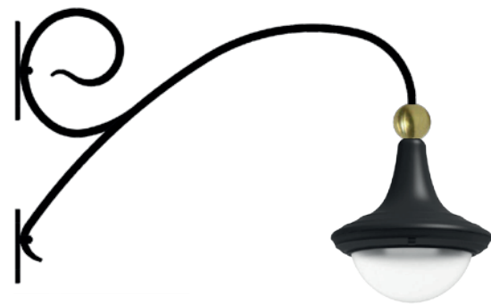
Voorbeeld van de nieuwe wandlampen.

De gemeente vervangt na de zomer in 2025 de lantaarnpalen in de winkelstraten in de binnenstad. In plaats daarvan komen er lampen aan de wanden. Wilt u zien hoe dat er in het echt uitziet? Kom dan eens kijken op de Varkensmarkt 20. Daar hangt binnenkort ook een voorbeeld van de nieuwe sfeerverlichting van de Ondernemersvereniging Binnenstad Amersfoort(OBA).