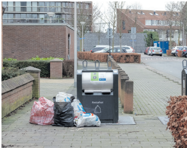
Het college gaat initiatieven om armoede tegen te gaan samenbrengen en versterken (bron: Uitvoeringsprogramma Meedoen en Rondkomen).

In 2025 start de eerste gelote Burgerraad van Amersfoort. Tijdens Het Besluit werden de raadsleden gevraagd om de startnotitie Gelote Burgerraad Afval vast te stellen.