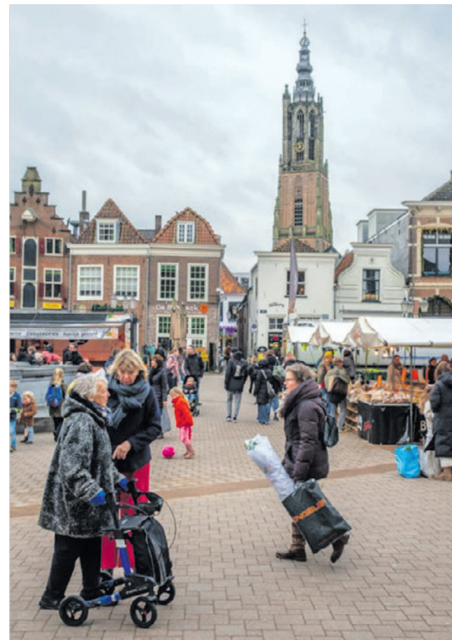
Het college gaat initiatieven om armoede tegen te gaan samenbrengen en versterken (bron: Uitvoeringsprogramma Meedoen en Rondkomen).

Het raadsvoorstel werd unaniem aangenomen.