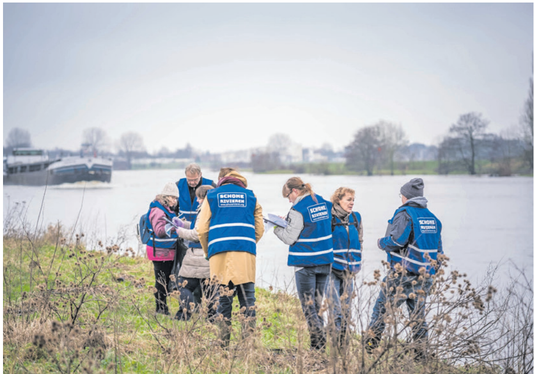
Vrijwilligers doen onderzoek naar zwerfafval.

U krijgt met z'n tweeën een tracé (onderzoekgebied) van ongeveer honderd meter toegewezen. Op dit tracé monitort u twee keer per jaar het afval. U deelt het bijvoorbeeld in categorieën in. Wat we van u vragen is dat u nauwkeurig kunt werken, zodat de metingen betrouwbaar zijn. Ook bent u communicatief