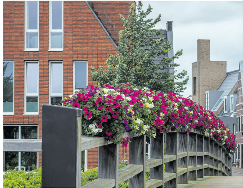
Kleurrijke bloembakken op de Terneuzerbrug.