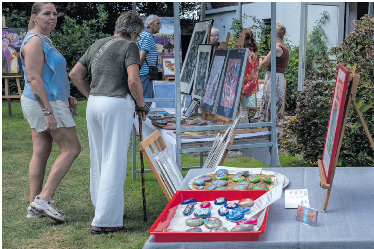
Coelhorst Art Event.

Het Coelhorst Art Event gaat niet alleen over kunst. Bezoekers uit Hoogland, Amersfoort en omgeving komen ook om elkaar te ontmoeten, bij te praten en te genieten van een hapje in de buitenlucht. Het evenement brengt mensen bij elkaar.