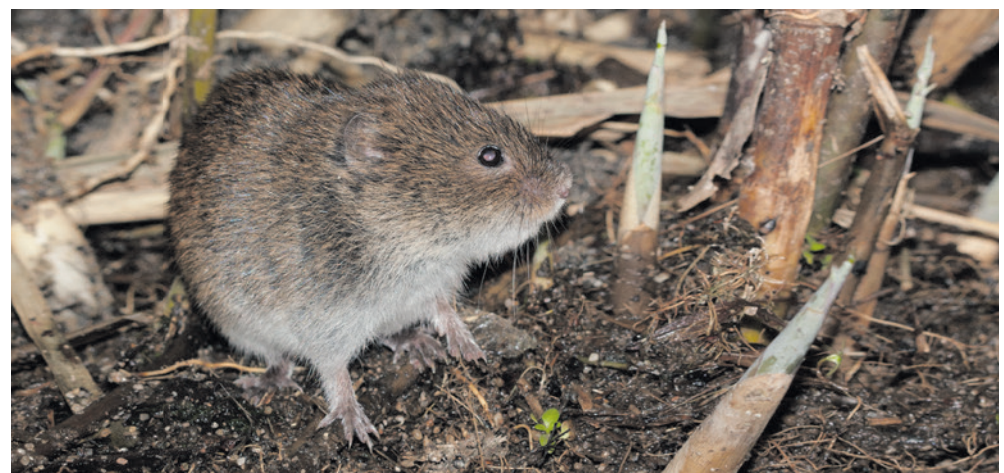
Woelmuizen komen hier veel voor.

Aanmelden: Verplicht via cnme@amersfoort.nl . Er is plaats voor maximaal 24 deelnemers, dus wees er snel bij.