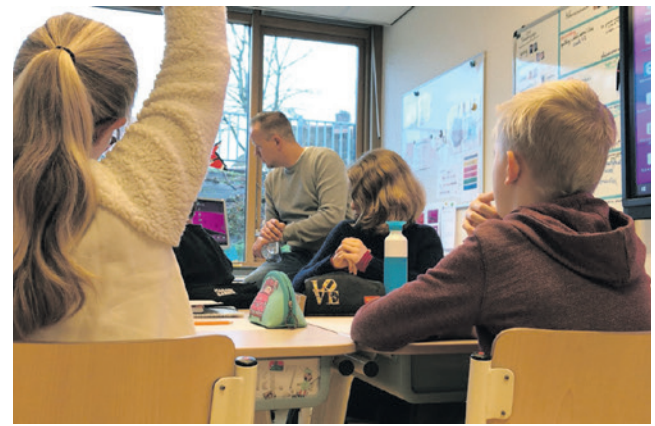
Elke leerling moet een plek op een school krijgen die bij hen past.

Het college stelde in november het Uitvoeringsprogramma Jeugd en Onderwijs (UPJO) 2025-2026 vast. Daarin staat hoe het college wil werken aan het doel dat alle jongeren in Amersfoort gezond, veilig en met veel kansen opgroeien. Het