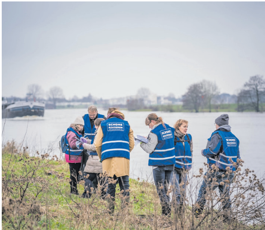
Vrijwilligers doen onderzoek naar zwerfafval.

Informatie over de gemeentebelastingen. www.amersfoort.nl/belastingen of bel 14 033