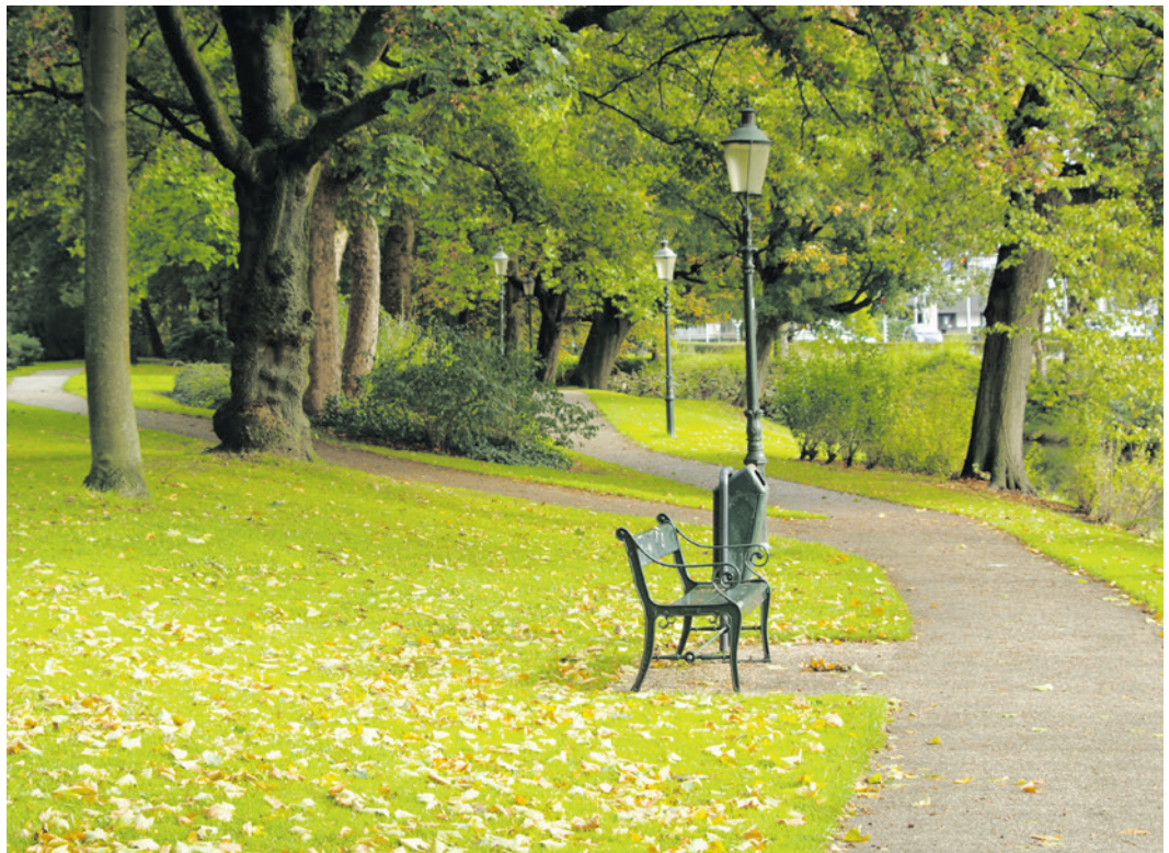
Veel mensen voelen zich eenzaam.

Voordat we met concrete oplossingen van start kunnen, onderzoeken we eerst goed wat eenzaamheid is en wat hier tegen helpt. Dit doen we tijdens drie bijeenkomsten samen met professionals en inwoners (vanaf 18 jaar) die zich wel eens of regelmatig eenzaam voelen. Zo hopen we ideeën te krijgen om eenzaamheid tegen te gaan en ontmoeting te stimuleren. Daarmee starten we proefactiviteiten. Dit noemen we een 'pilot'. We kijken daarbij welke activiteiten goed werken en welke nog verbetering nodig hebben. Dit voeren we voor de zomervakantie uit. Ook leren we van de ervaringen van de andere Europese steden.