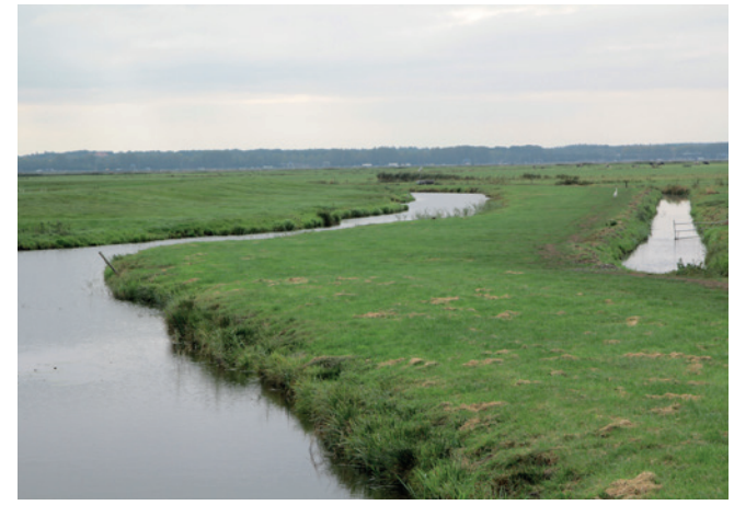
Hoe hoog moet het water staan?

Heeft u vragen over de inloopbijeenkomst? Neem dan contact op met Waterschap Vallei en Veluwe via 055 52 72 911.