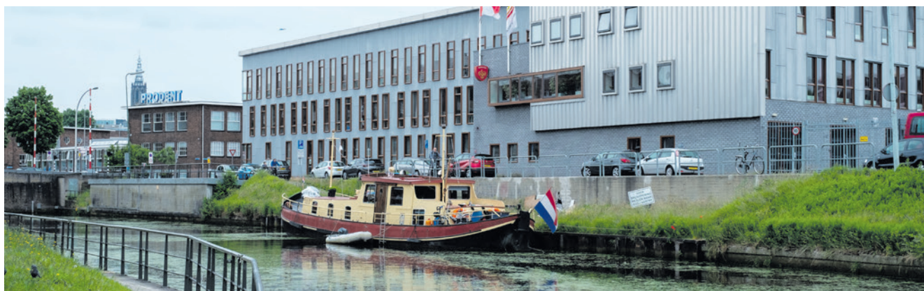
De Veiligheidsregio Utrecht is een samenwerkingsverband op het gebied van de brandweer en crisisbeheersing.

Op basis van de reacties van de Utrechtse gemeenteraden stelt de VRU vervolgens de begroting voor 2026 op.