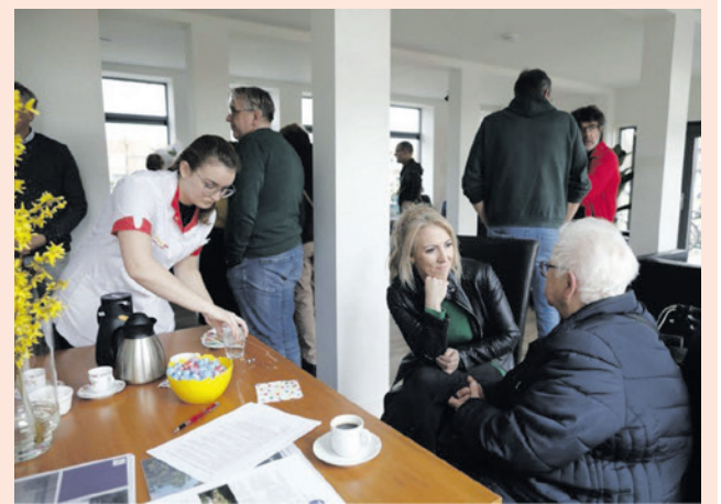
Het eerste zorgbuurthuis werd in 2023 geopend in Oss (foto: SP).

Vorig jaar heeft de commissie het onderwerp zorgbuurthuis op verzoek van de SP twee keer besproken. De fractie heeft daarna gesprekken gevoerd met woningcorporaties en een sociale ondernemer en wil nu een volgende stap zetten. Deze partners vertellen tijdens de vergadering hoe ver zij zijn met hun plannen voor wonen en zorg. Ook vertellen zij over kansen en problemen.