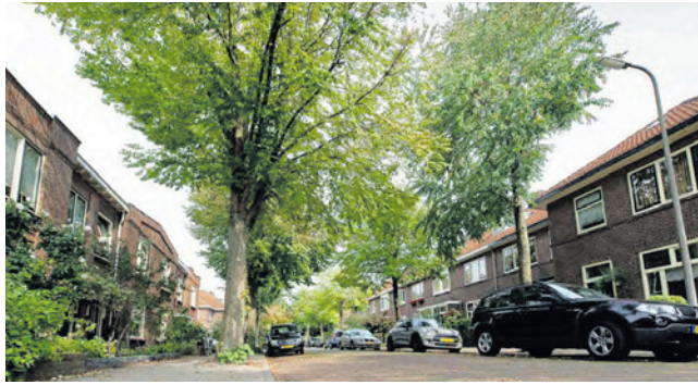
Meer bomen kunnen helpen bij het veranderende klimaat.

Bij het vernieuwen van wijken richt het college de openbare ruimte opnieuw in. Bij deze projecten probeert het college doelen op het gebied van klimaatadaptatie (het aanpassen