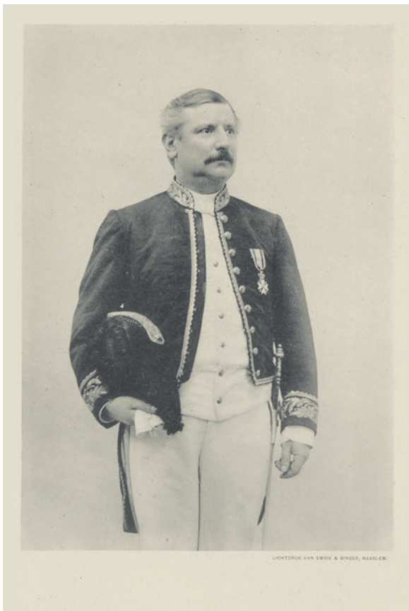
Voormalig Amersfoortse burgemeester en gouverneur van Suriname Van Asch van Wijck.

Na de officiële afschaffing van de slavernij in 1863 moesten mensen die hiervoor tot slaaf waren gemaakt, nog 10 jaar op de plantages blijven werken. Gouverneur Van Asch van Wijck zette zich in om nieuwe arbeiders te zoeken, die hij een contract en loon beloofde. Vooral voor de suikerplantage Mariënborg, eigendom van de Nederlandse Handelsmaatschappij. In het begin kwamen de contractarbeiders uit Brits-Indië. Maar de omstandigheden op de plantages waren zo slecht, dat de Britten niet meer met hem wilden meewerken. Daarna richtte hij zich op Nederland-Indië, vooral Java. Hij lokte mensen vaak met mooie verhalen, zonder dat ze precies wisten waar ze naar toe gingen en onder welke omstandigheden ze zouden komen te leven. Contractarbeid in die tijd was een vorm van dwangarbeid. Plantage-eigenaren hadden volledige macht over hun arbeiders.