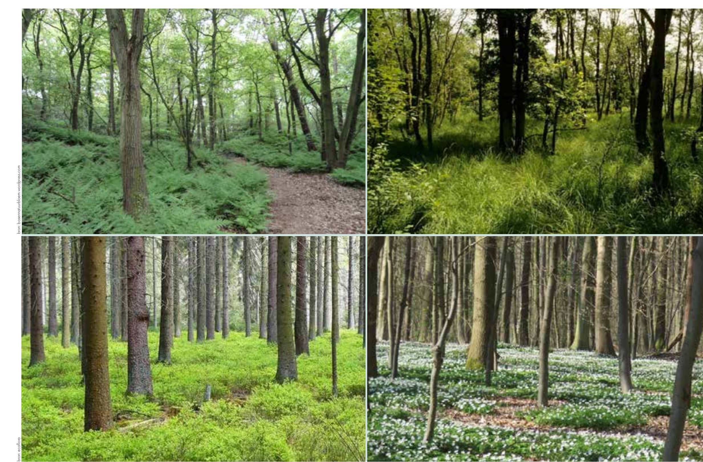
inspiratie: sterke bosbeelden